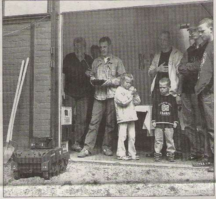
Natürlich gab's einige Gefährte auch „in Aktion“ zu sehen.